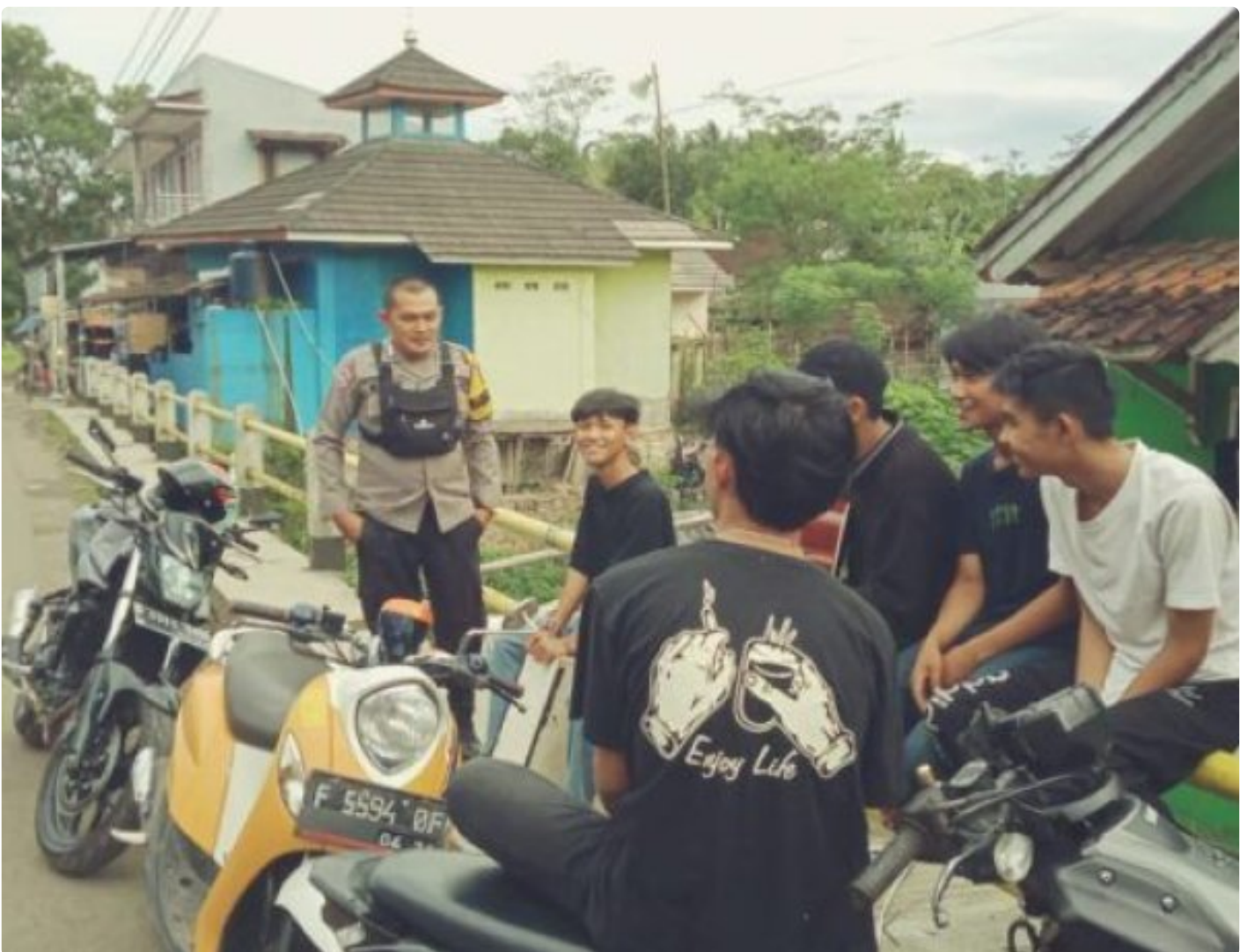
Polsek Cireunghas Polres Sukabumi Kota

Kota Sukabumi – Polres Sukabumi Kota Polda Jawa Barat – Polsek Cireunghas melaksanakan kegiatan dialogis dengan para pengemudi angkutan umum di jalan sempur, Selasa (30/1/24). Kegiatan ini bertujuan untuk menyampaikan himbauan kamtibmas kepada para pengemudi dan meningkatkan kerja sama antara